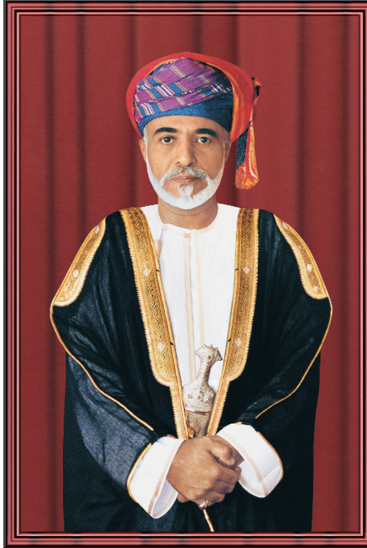
حضرة صاحب الجلالة السلطان قابوس بن سعيد المعظم